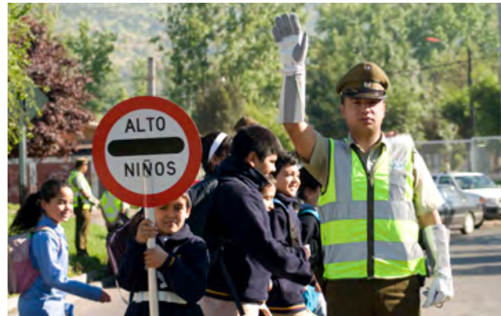
Carabinero dirigiendo el tránsito en Santiago, siglo XXI