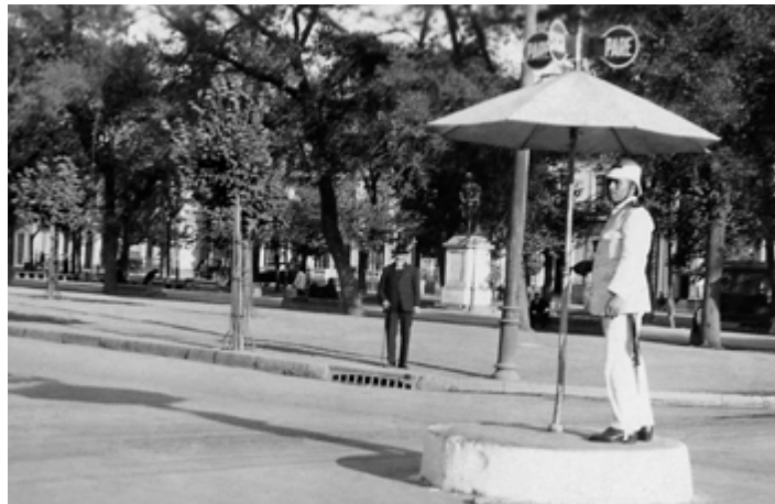
Policía Fiscal dirigiendo el tránsito en Santiago, principios del siglo XX